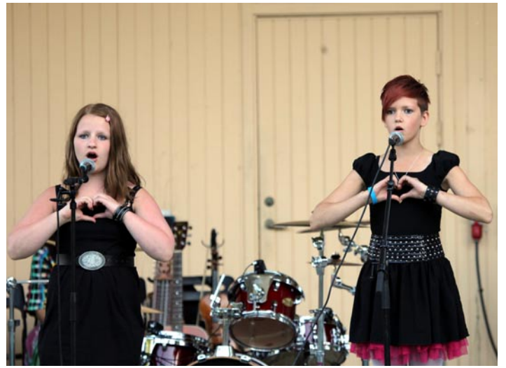
Talanger. Unga bandet Lying Moose överraskade "Äntligen måndag"-publiken i Stadsparken med Primus-låten "Too Many Puppies" medan Rebecka & Matilda från Marmorbyn charmade med välkoreograferad a cappella-sång.